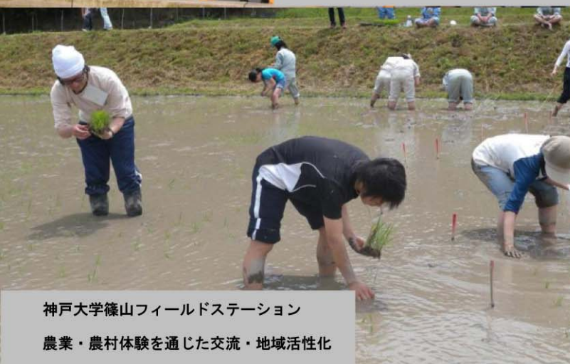
神戸大学篠山フィールドステーション 農業・農村体験を通じた交流・地域活性化

日時 平成22年12月12日(日) 13:30～17:00(13:00開場) 場所 JA丹波ひかみ柏原支店 2階大会議室 定員 100名(参加無料)