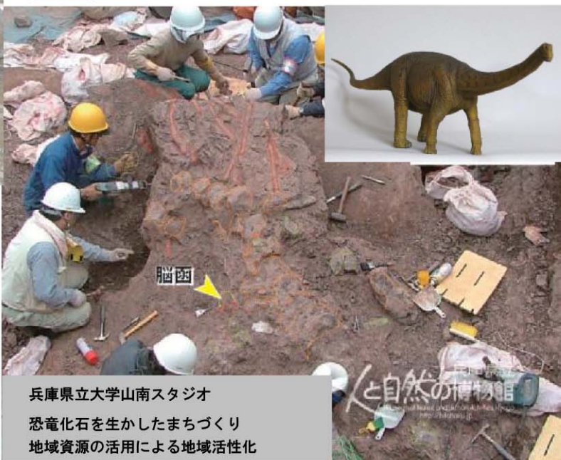
兵庫県立大学山南スタジオ 恐竜化石を生かしたまちづくり 地域資源の活用による地域活性化

日時 平成22年12月12日(日) 13:30～17:00(13:00開場) 場所 JA丹波ひかみ柏原支店 2階大会議室 定員 100名(参加無料)