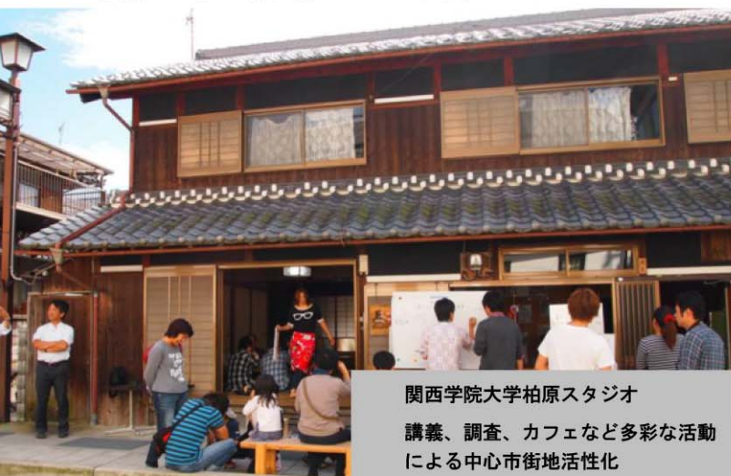
関西学院大学柏原スタジオ 講義、調査、カフェなど多彩な活動による中心市街地活性化