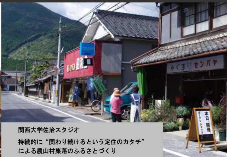
関西大学佐治スタジオ 持続的に“関わり続けるという定住のカタチ”による農山村集落のふるさとづくり