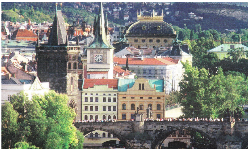
カレル橋と国民劇場(プラハ)