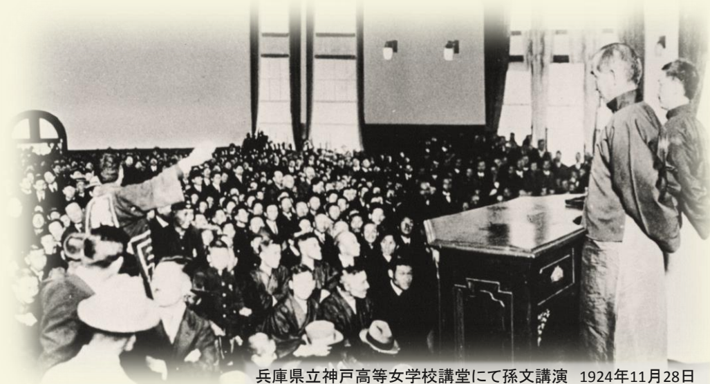
兵庫県立神戸高等女学校講堂にて孫文講演 1924年11月28日

本シンポジウム・講演会は、「大アジア主義」講演に込められた孫文の思想を丁寧に読み解きながら、「東アジア共同知」の学術的意義を探るとともに、彼が遺した政治的・文化的資源の価値について再認識するものです。