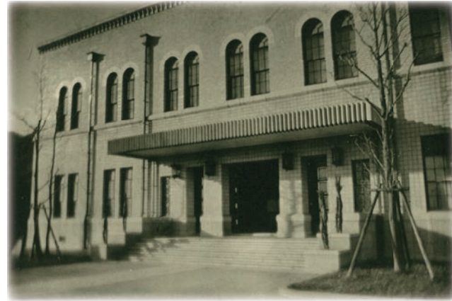
▲ 旧制神戸商業大学附属図書館の正面玄関 1939(昭和14)年頃