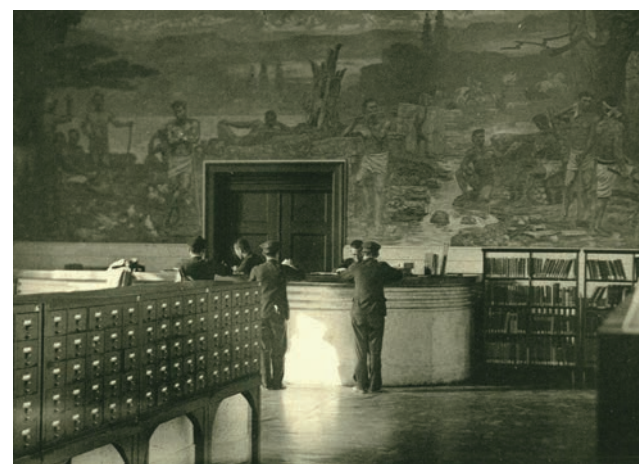
▲ 旧制神戸商業大学附属図書館2階出庫カウンターと大壁画「青春」 1939(昭和14)年頃

年兵庫県南部地震(阪神・淡路大震災)が発生し多数の犠牲者が出た際には、被災地の中心にある図書館の責務として貴重な震災資料の収集保存のため「震災文庫(阪神・淡路大震災関係資料文庫)」が、1999(平成11)年神戸大学電子図書館システム運用開始の際には電子情報掛(現・電子図書館係)がそれぞれ人文・社会科学系図書館の建物内に設置されるなど、本学附属図書館の軸であり続けた。