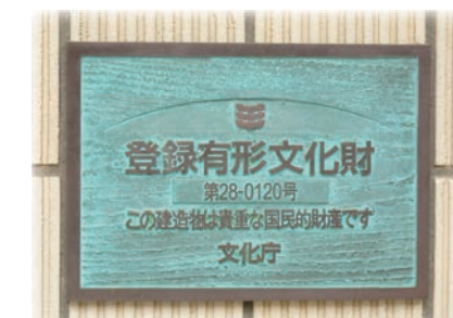
▲ 国の登録有形文化財となる 2003(平成15)年3月18日登録