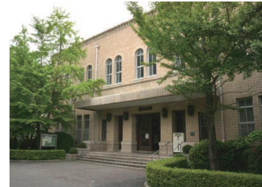
▲ 神戸大学附属図書館社会科学系図書館の正面玄関と本館2階天井のステンドグラス ステンドグラスには「KOBEL」・「UNIVERSITY」の文字が刻まれている 2012(平成24)年

なお、2004(平成16)年国立大学法人化を機に、社会科学系図書館と改称。さらに国際文化学図書館と同一施設内に「総合図書館」が設置されたが、総合図書館の独立建物が新築されるまでの当分の間、中央機能は引き続き社会科学系図書館に置かれている。(文責:神戸大学附属図書館大学文書史料室 野邑理栄子)