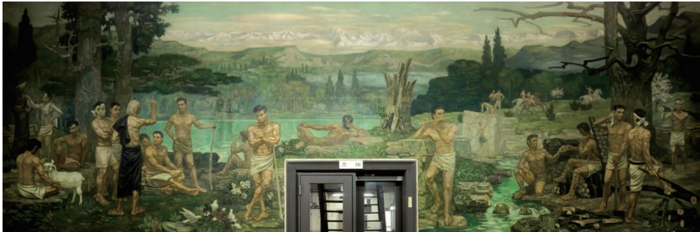
中山正實作、神戸大学附属図書館社会科学系図書館の大壁画「青春」 1935(昭和10)年10月完成(2008(平成20)年8月撮影)