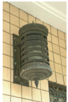
▲ 正面玄関外の照明 2012(平成24)年