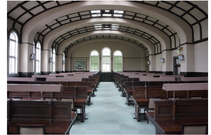
(左) 正面玄関 (右) 大閲覧室 2012(平成24)年5月