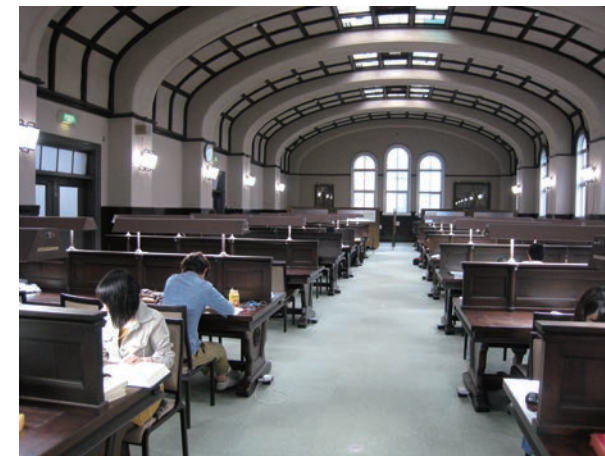
▲ 神戸大学附属図書館社会科学系図書館本館2階「大閲覧室」 2012(平成24)年