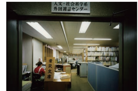
▲ 人文・社会科学系外国雑誌センターと震災文庫 2001(平成13)年頃