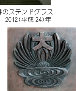
▲ 大閲覧室の閲覧机脚部の彫刻 2012(平成24)年