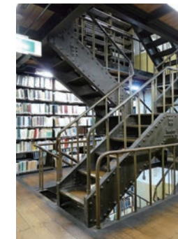
▲ 「書庫C棟」の重厚な階段と書架 2012(平成24)年