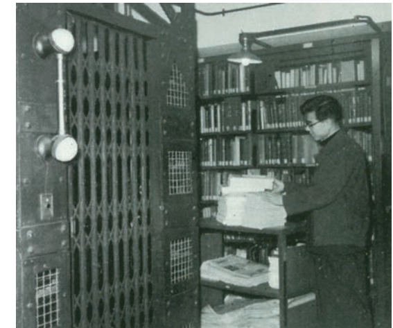
▲ (左上) 竣工当初の書庫の様子 1938(昭和14)年頃 (右上) 旧制神戸商業大学附属図書館の蔵書印の一つ (下) 神戸大学附属図書館六甲台分館時代の書庫のエレベーター 1954(昭和29)年頃