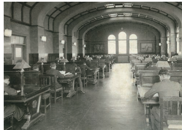
▲ 旧制神戸商業大学附属図書館2階「大閲覧室」1937(昭和12)年頃