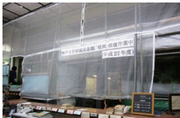
▲ 修復の様子 2011(平成23)年2月

まず、画面中央には、主軸となる2個のテーマが設定されている。上部には、 メインテーマ「理想」 を示す遙か遠くの高く清らかな雪の連峰が描かれており、その下には、雪の連峰を遠くから眺めて高さ理想に思いを馳せる青年と、折り倒されてもおお根元に新芽を吹く樹木が描かれ「 希望 」を示している。