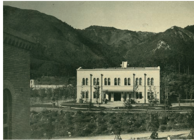
▲ 竣工まもなくの旧制神戸商業大学附属図書館の遠景 1937(昭和12)年頃

1949(昭和24)年新制神戸大学の誕生により、旧神戸経済大学附属図書館は、神戸大学附属図書館六甲台分館(法学部、経済学部、経営学部、経済経営研究所の図書館)に引き継がれた。附属図書館には当初4つの分館が設置されたが、六甲台分館は、学内最大の図書館施設と最大の蔵書数を誇る中心的存在であり、同年、同分館の建物内に中央図書館が設置された。1980(昭和55)年六甲台図書館と改称、1981(昭和56)年同館に管理棟が竣工、1984(昭和59)年同館と文学部図書館を統合して人文・社会科学系図書館が設置され、自然科学系図書館と共に2大中央図書館制(1992(平成4)年まで)が築かれた。1986(昭和61)年文部省から人文・社会科学系外国雑誌センターに指定されると、人文・社会科学系図書館の建物内に同センターが設置され、1995(平成7)