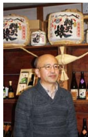
●太田酒造場のブランドは「辨天娘」