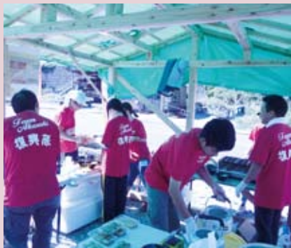
●東日本大震災ボランティア活動