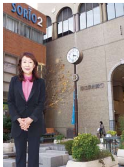
●「ますたにデンタルクリニック」は阪急宝塚駅にある