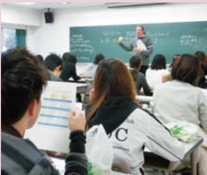
●PSA (Pre-Study Abroad) 研修オリエンテーション