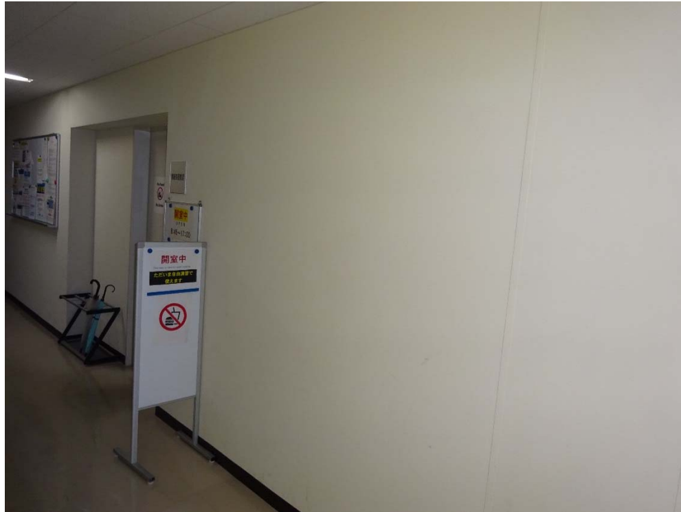
【別称等の掲示場所】