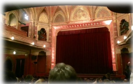
← 滞在中行われていたフランコフォニー映画祭