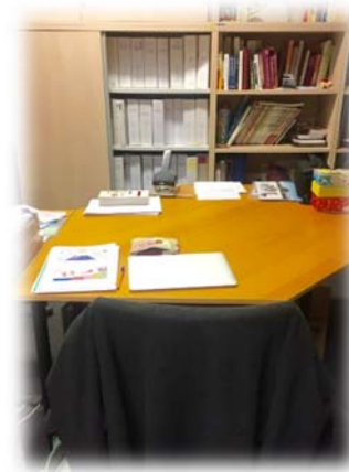
2週間お世話になったデスク →