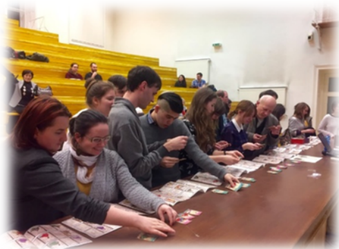
←好きな百人一首かるたを持って帰れる