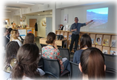
↑考古学セミナーの様子

何よりも印象的だったのは、どの催し物でも、来場者の興味や熱意を感じ、満足そうな様子だったことである。「とても良かった!」「ありがとう」と笑顔で言ってくれる方もいて、私自身も嬉しく、その言葉や表情がイベントの成功を意味しているのだと思うと同時に、基金が果たす役割の大きさを感じた。