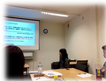
今月の議題は「ポートフォリオの使い方」 ディスカッションにも参加させていただいた。

さらに、センターでは月1回、夜間日本語講座の講師会が開かれ、普段異なるクラスを担当する先生の間で近況報告や課題共有・意見交換をする場が設けられている。