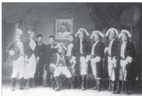
▲ 第1回語学大会仏語対話 1907 (明治40) 年