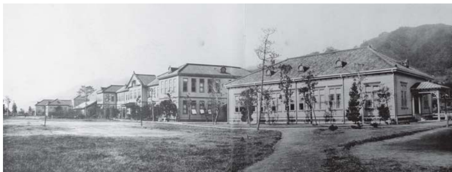
▲ 神戸高等商業学校の前景。所在地は、神戸市葺合町筒井村字籠池(現在の中央区野崎通1丁目)。

神戸大学の礎である旧制官立神戸高等商業学校 (神戸高商、1902-1929年) では、水島鍊也初代校長を中心に、旧来の高等教育の常識を刷新する革新的な教育改革を次々と断行するとともに、人間味あふれる教育環境を作り出し、近代日本を先導する多くの優れた卒業生を輩出しました。こうした神戸大学百有余年の伝統ある歴史の一端を、貴重な歴史資料や写真などで紹介します。皆様のご来場をお待ちしております。