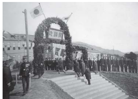
▲ 開校の様子 1903 (明治36) 年10月