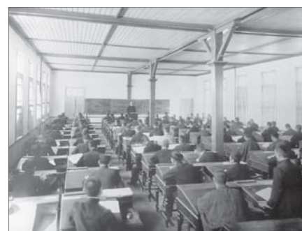
▲ 外国実践教室の講義 1909 (明治42) 年頃 外国実践教室での商業学講義は英語で行われた。