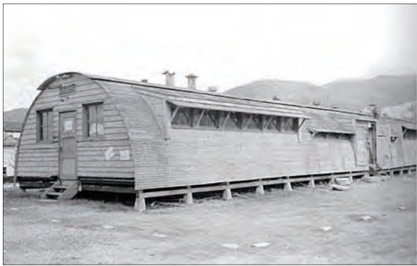
▲ 御影分校のカマボコ学舎 (旧制兵庫師範学校男子部 (元・御影師範学校) と神戸経済大学予科の跡地) 1962 (昭和37) 年頃