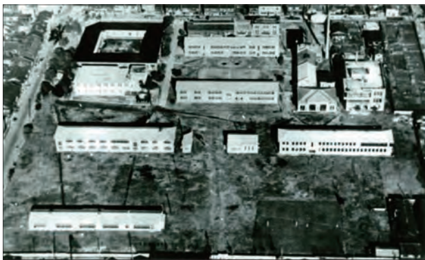
▲ 工学部の西代学舎 (旧制神戸工業専門学校の跡地) (現存せず) 1956 (昭和31) 年