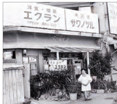
▲ 食堂「エ克蘭」。六甲登山口の交差点の南西角にあった。 1986 (昭和61) 年頃