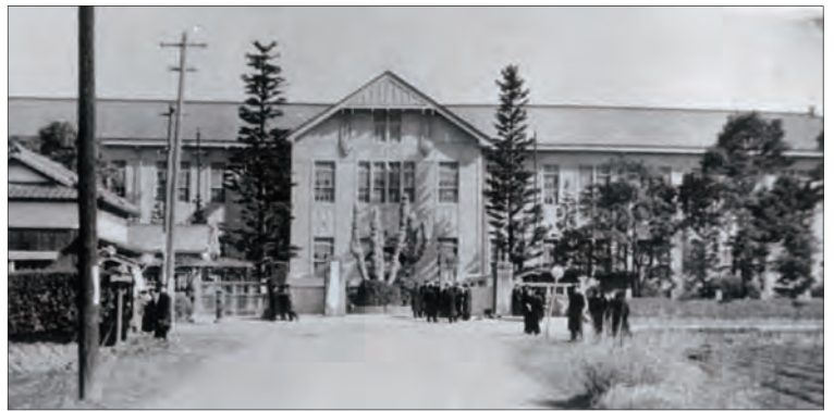
▲ 姫路分校の正門と本館 (旧制姫路高等学校の跡地) 1956 (昭和31) 年頃