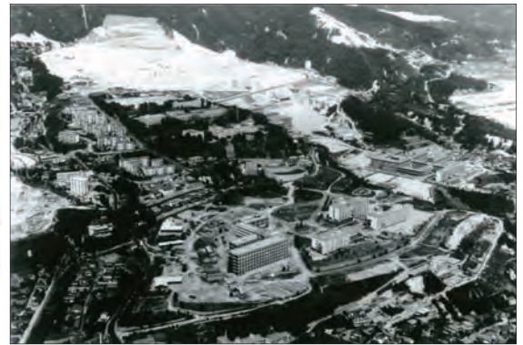
▲ 学舎整備中の六甲台地区。六甲山の斜面が削られ、教育学部新校舎や鶴甲団地の土地が造成されている。 1967 (昭和42) 年頃