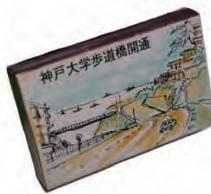
▲ 教養部「歩道橋開通」記念マッチ (現・16系統バス停「神大国際文化科学研究科前」付近) 1968 (昭和43) 年頃