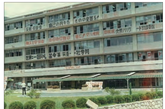
▲ 紛争当時、学生に占拠された教養部A棟 1969 (昭和44) 年頃