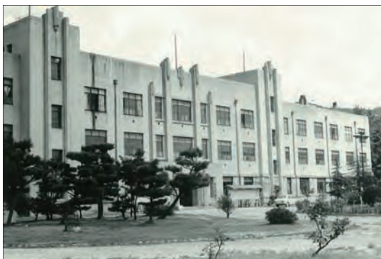
▲ 教育学部の住吉学舎 (赤塚山、旧制兵庫師範学校男子部の跡地) (現存せず) 1968 (昭和43) 年頃