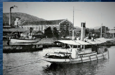
汽艇 深江丸(I) 【神戸高等商船学校】

またあわせて、日本の海事史上重要な船船として“ふね遺産”に認定された戦前の練習船、進徳丸について、昨年2021年度の企画展を再構成してご紹介いたします。