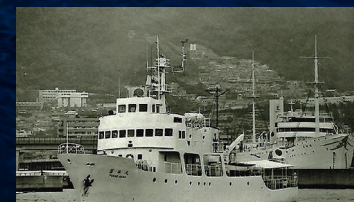
実習船のち練習船 深江丸(III) 【神戸商船大学】