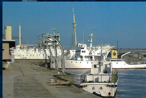
陸揚げ保存の進徳丸と深江丸(I)