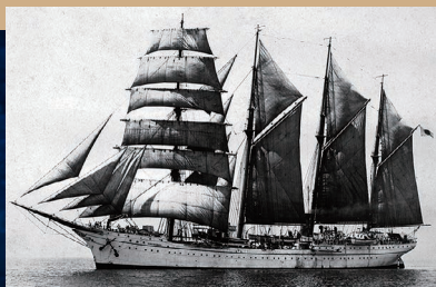
練習帆船・汽船・陸揚げ保存船 進徳丸 【神戸高等商船学校】