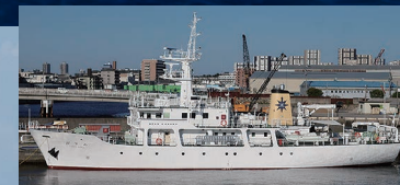
練習船 深江丸(IV) 【神戸商船大学・神戸大学】