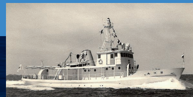
実習船 深江丸(II) 【神戸商船大学】