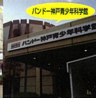
バンドー神戸青少年科学館