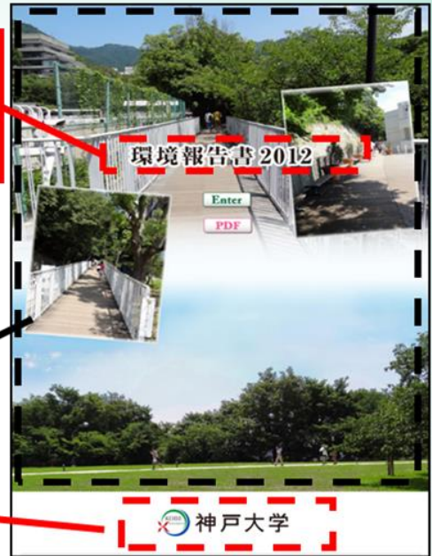
「表紙イメージ」写真が縦の場合