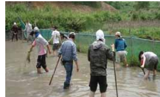
フィールドワーク

全学部の学生が、所定の単位を修得することでESDコース修了の認定を受けることができます。修了生には、あらゆる人々がSD（持続可能な開発）づくりの主体になるためのサポーター・ファシリテーター・コーディネーターになることが期待されます。アクティブラーニング・フィールド学習、アクションリサーチの手法の中で、多様な人々と共に、実践の中で、地球の持続可能性を脅かす諸問題と向き合う主体となっていく方法・条件・環境（教育）を考えます。