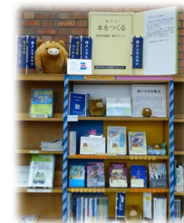
神戸市立中央図書館での出版物展示